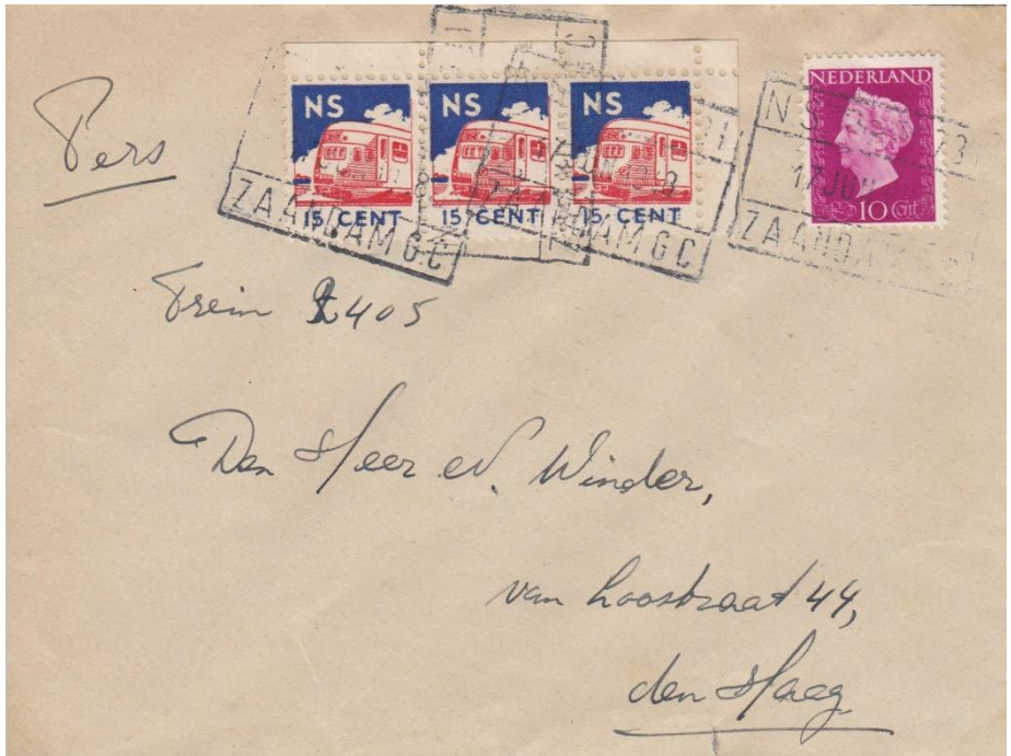
Zaandam 17 juni 1948, treinbrief naar Den Haag, 10 cent port, drie verantwoordingszegels van 15 cent. Mogelijk werden er drie brieven tegelijk aangeboden.