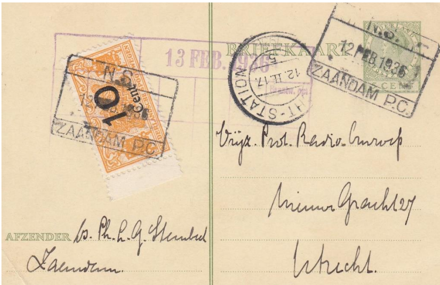
Zaandam, 12/2/1936, naar Utrecht. Aankomst zelfde dag. Stempel bagage bureau Zaandam Zegel recht N.S./ 10 cent

Met behulp van spoorwegzegels (“verantwoordingszegels”) werd dat op het poststuk verantwoord, volgens voorschrift (bij brieven) op de achterzijde, maar dat voorschrift werd vaak niet opgevolgd. Deze zegels werden vernietigd met het stempel van het bagagebureau, of met de pen door de conducteur. De zegels zijn in de literatuur uitvoerig gedocumenteerd op drukker, type, tanding en gebruiksmogelijkheden. Het boekje ‘Spoor en Post’ (Uitgave Spoorwegmuseum) is verplichte kost voor verzamelaars.