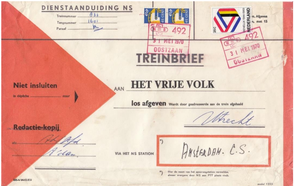
Treinbrief uit Oostzaan, via Amsterdam CS naar Utrecht, met kopij voor Het Vrije Volk. Port 1 o gewichtsklasse, treinzegel nr. 2, 2x (zondag tarief)

Kranten maakten veel gebruik van de mogelijkheid om persberichten en foto's op tijd bij de redactie te krijgen. Daardoor zijn er nogal wat treinbrieven bewaard gebleven die gericht waren aan de redacties van kranten. De hierboven afgebeelde brief aan de redactie van Het Vrije Volk is er een voorbeeld van. Op de volgende bladzijde een ander exemplaar, door Jan Kluit uit zijn verzameling gevist. Hij werd op 25 maart 1964 verstuurd van Amsterdam naar Haarlem (redactie Haarlems Dagblad).